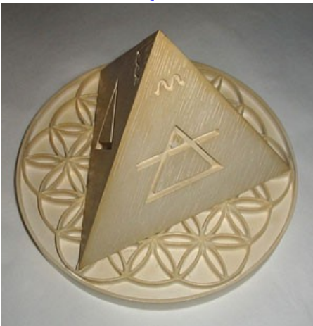
Tétraèdre et Quantum de Ptah